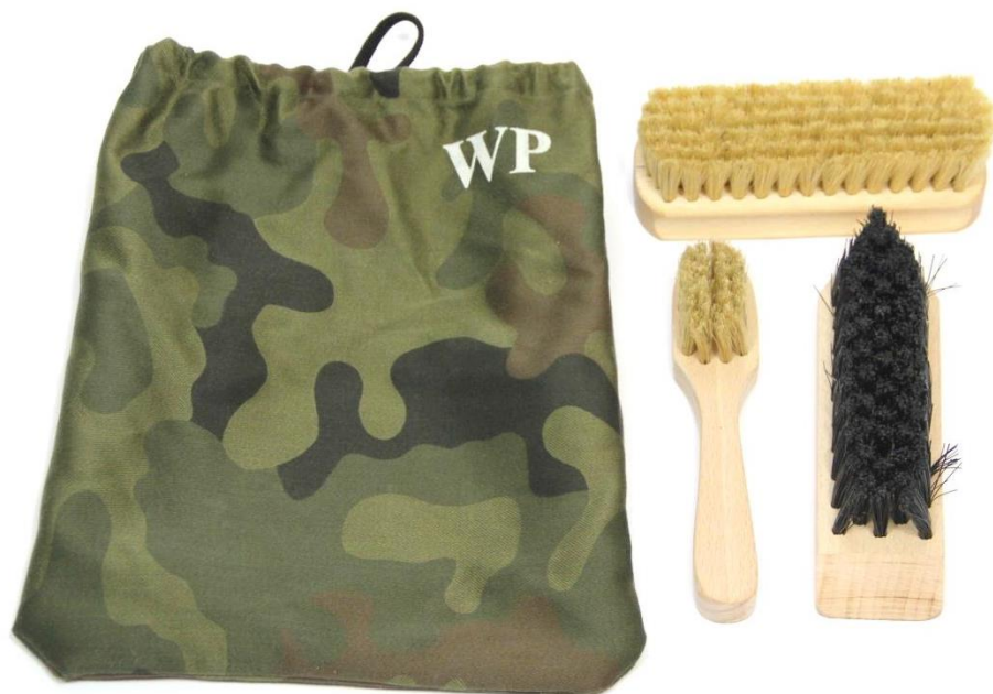
Zestaw przyborów do konserwacji obuwia - Wzór 816/MON