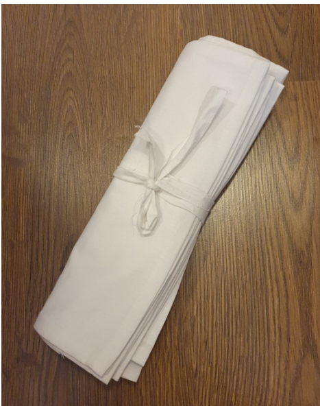
Fot. 2. Przykład złożonych w rulon woreczków