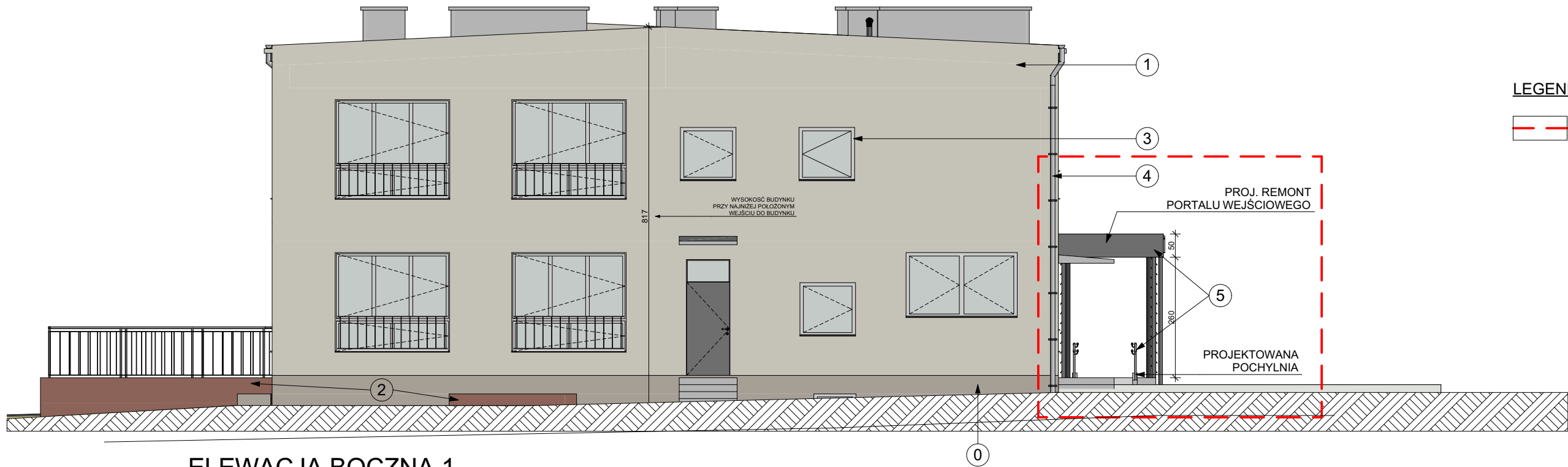
ELEVACJA BOCZNA 1