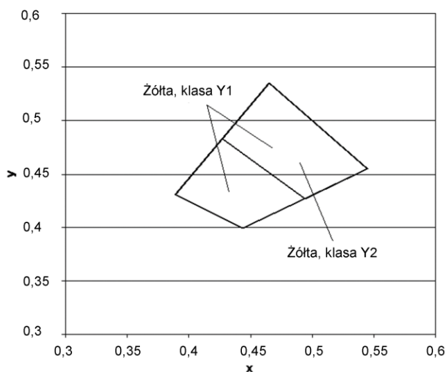
Rys.2. Współrzędne chromatyczności x,y dla barwy żółtej oznakowania