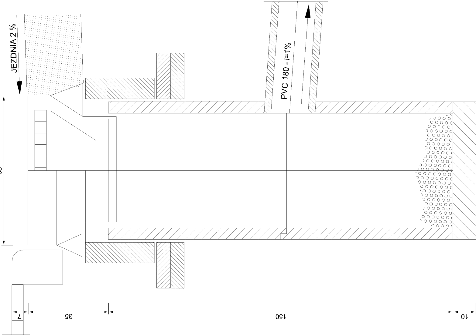
WPUST ULICZNY DESZCZOWY BEZ SYFONU skala 1 : 10

WPUSTY I STUDNIE REWIZYJNE SYTUOWAĆ I MONTOWAĆ WEDŁUG PLANU I PRZĘKROJU PODŁUŻNEGO