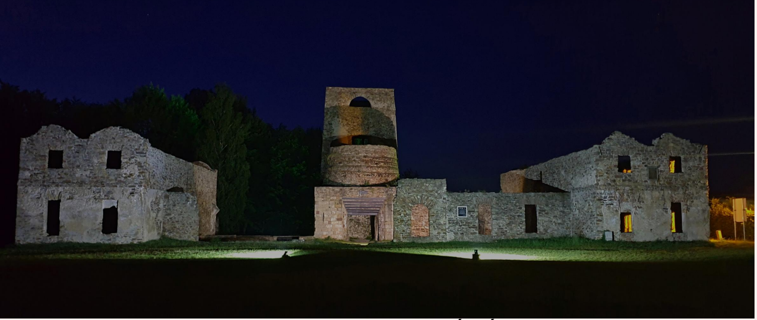
Próby świetlne na terenie kompleksu ruin

Ruiny huty oświetlone zostaną iluminacją podkreślającą sylwetkę i monumentalizm poszczególnych gmachów i faktury murów. W celu zaakcentowania i wydobywania istotnych partii ruin i specyficzną dla tego unikatowego zespołu dawnych zabudowań przemysłowych harmonię i symetrię, iluminację należy przeprowadzić za pomocą oświetlenia o różnicowanej temperaturze bieli 5500K oraz 4000K.