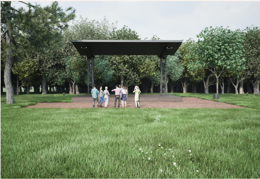
Widok na planowaną scenę