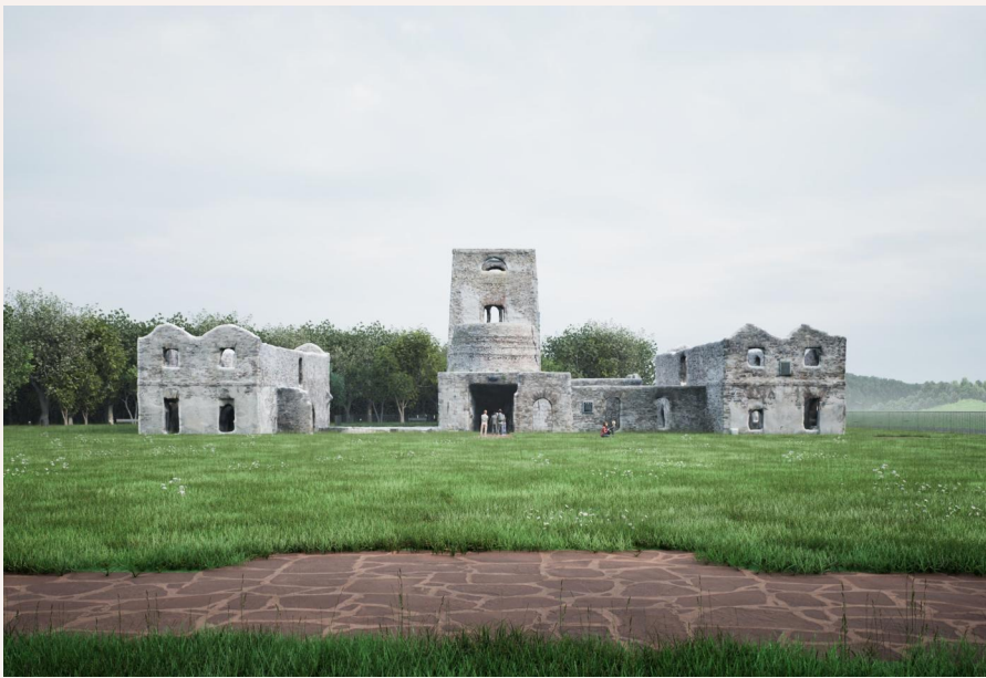
Widok na kompleks ruin