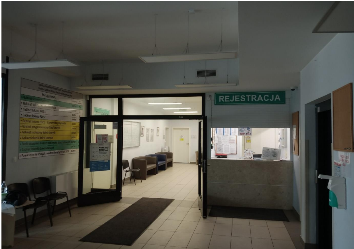
Fot.1 Stan istniejący Przychodnia Rejonowa Nr 4. Recepcja