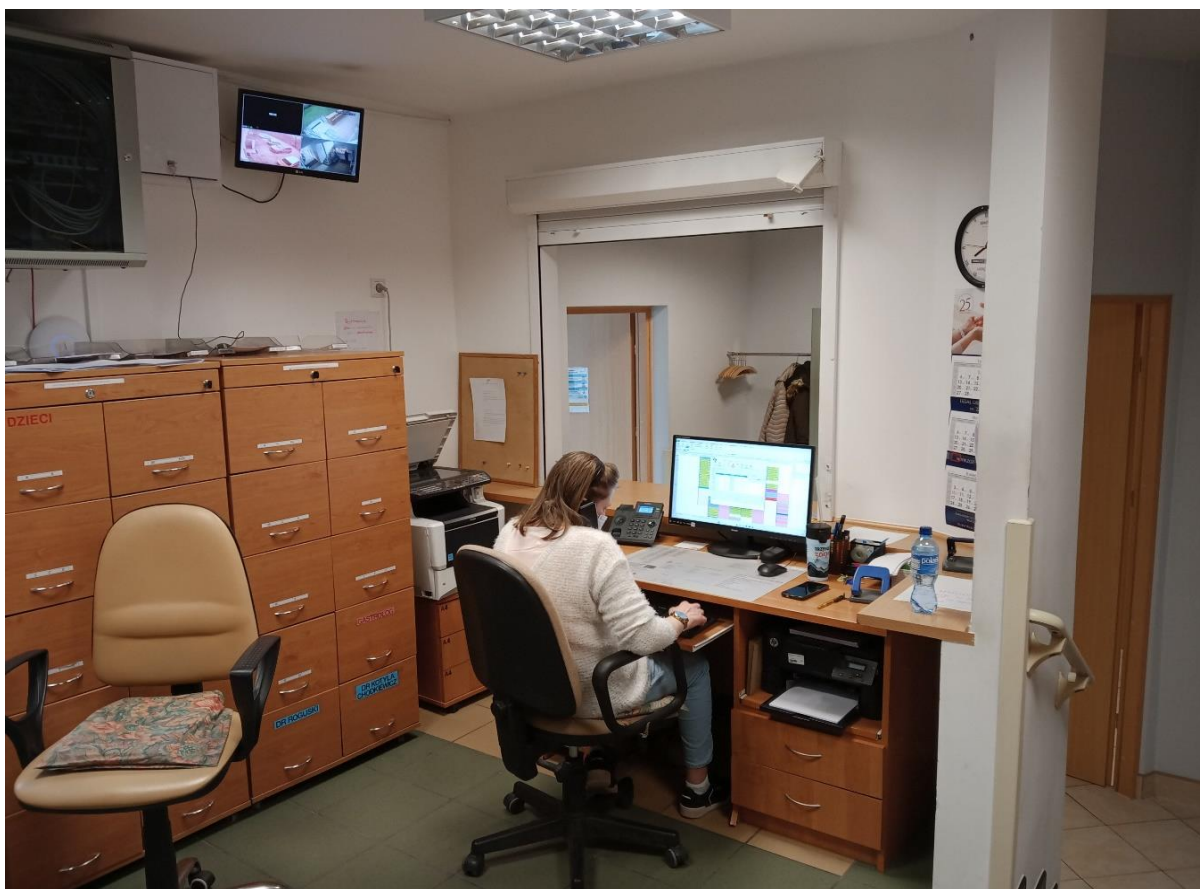
Fot.2 Stan istniejący Przychodnia Rejonowa Nr 2. Recepcja II