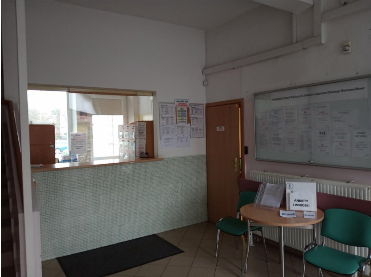
Fot.1 Stan istniejący Przychodnia Rejonowa Nr 6. Recepcja I