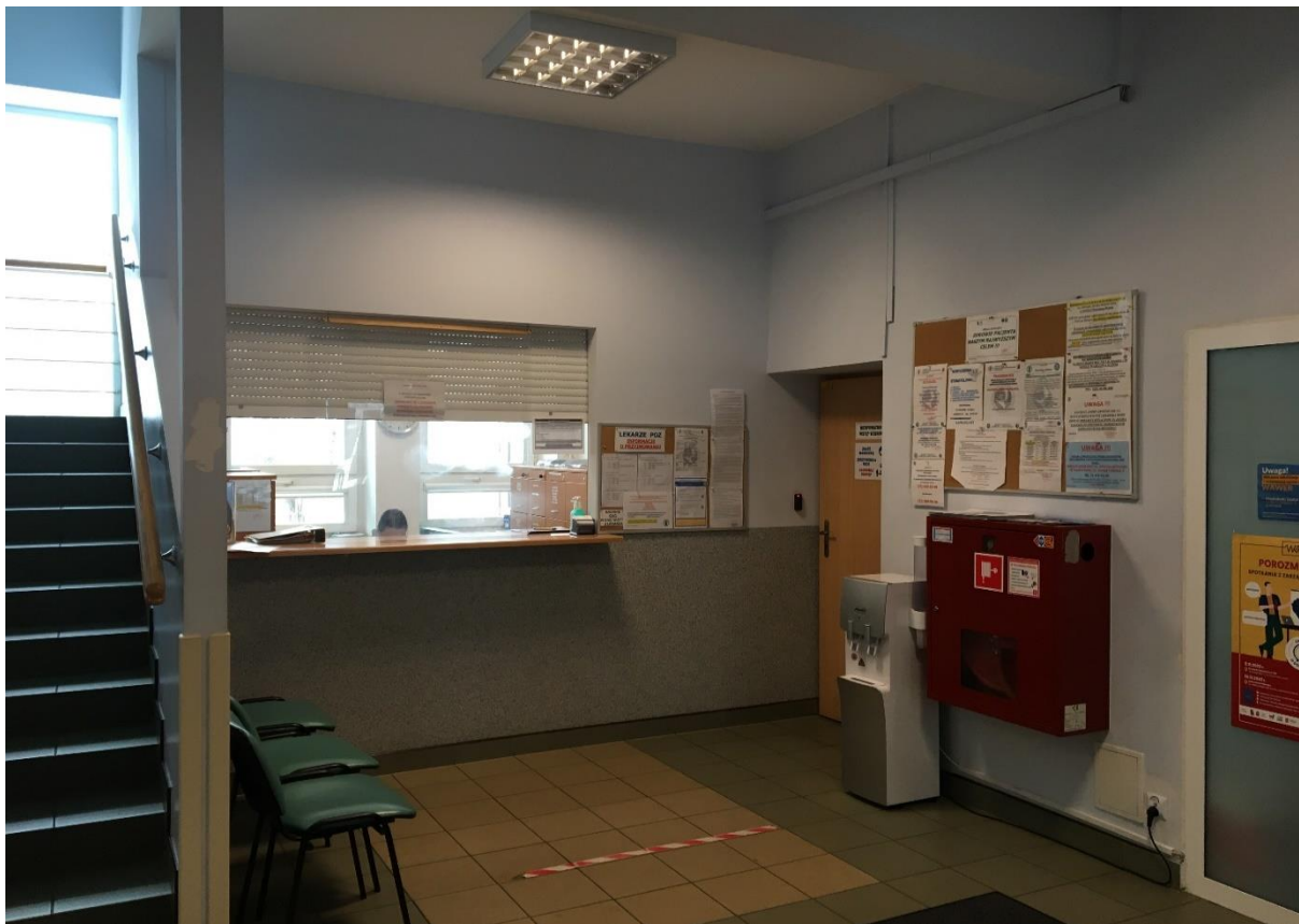
Fot.1 Stan istniejący Przychodnia Rejonowa Nr 2. Recepcja I