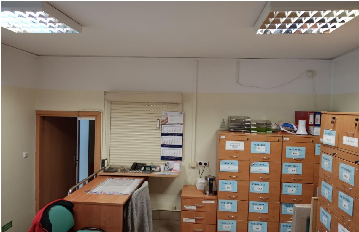
Fot.2 Stan istniejący Przychodnia Rejonowa Nr 6. Recepcja II