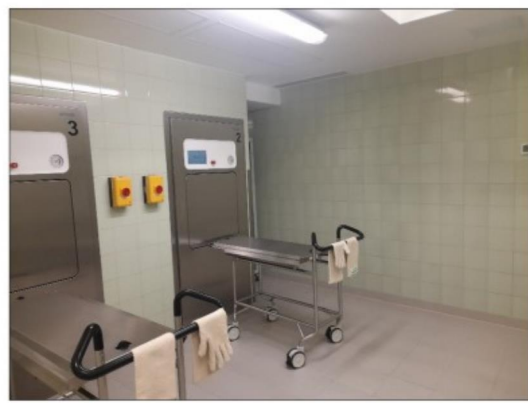
Zdjęcie nr 12 - pom. nr 1.45