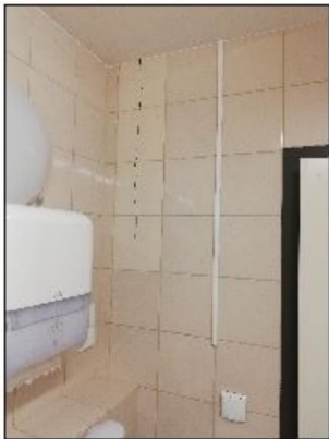
Zdjęcie nr 8 - śluza