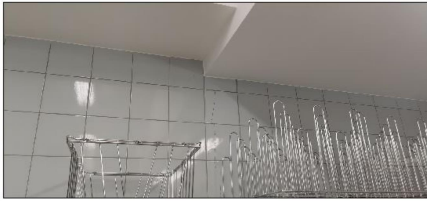
Zdjęcie nr 10 - pom. nr 1.56