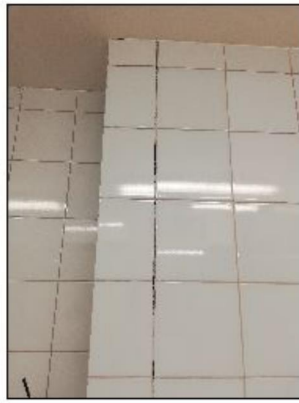
Zdjęcie nr 11 - pom. nr 1.56