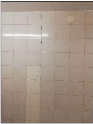
Zdjęcie nr 9 - śluza