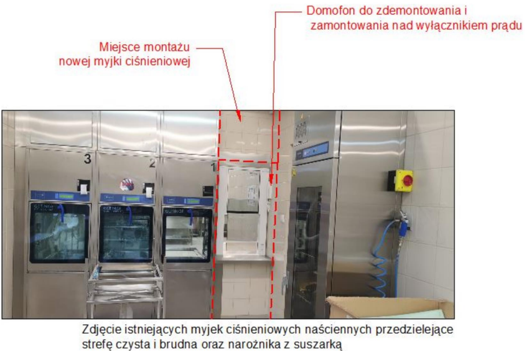
Zdjęcie istniejących myjek ciśnieniowych naściennych przedzielające strefę czysta i brudna oraz narożnika z suszarką