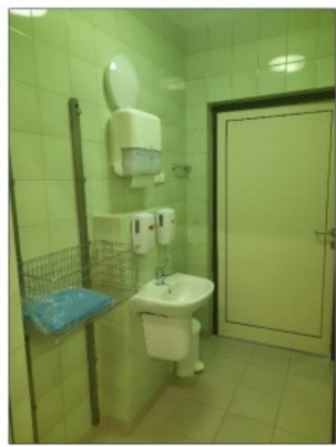
Zdjęcie nr 12a - pom. nr 1.46