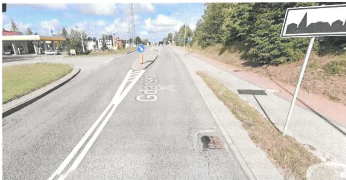
Rysunek 3. Widok drogi DW221

Jednocześnie planowana jest rozbudowa drogi na odcinku na dojazdach do granicy Nowej Karczmy z kierunku Kościerzyny oraz Przywidza. Inwestycje te przewidują podniesienie nośności nawierzchni do 115kN/oś oraz konstrukcję dla ruchu KR4.