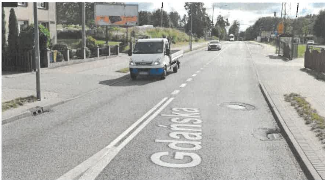
Rysunek 4. Widok drogi DW221