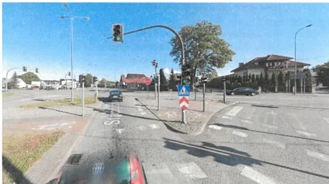
Rysunek 5. Widok skrzyżowania z DW224