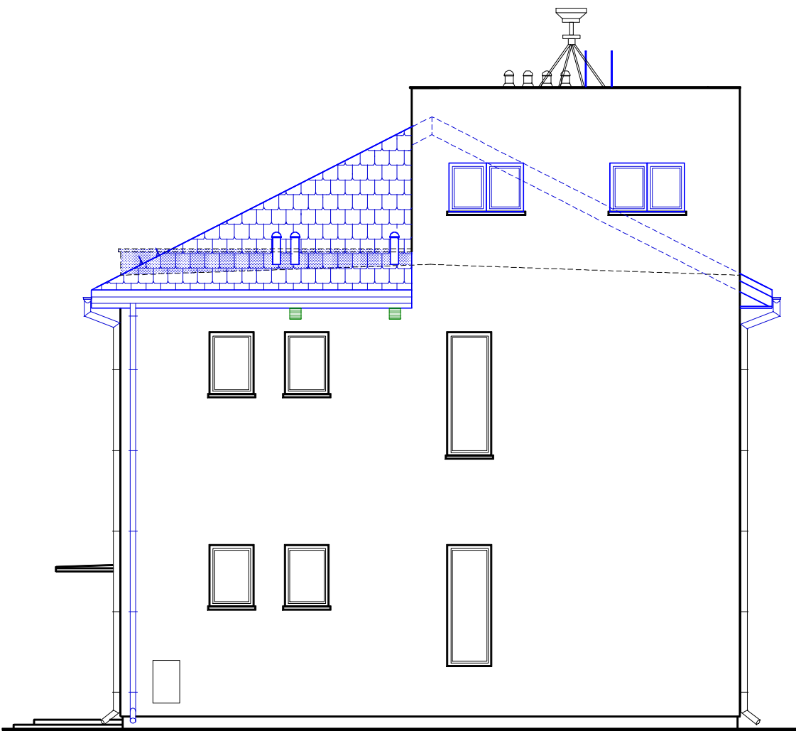
ELEWACJA POŁUDNIOWO- ZACHODNIA