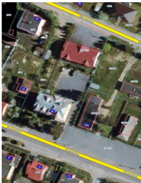
Rysunek nr 2. Lokalizacja dz. nr ew. 152/12 i 152/11 : Budynek Urzędu Gminy , ul. Kowalska 14 (źródło: https://zarebykoscielne.e-mapa.net/ dostęp na dzień 23.12.2022 r.)