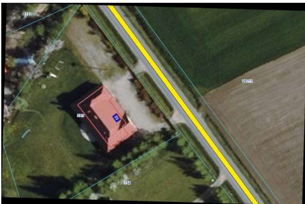
Rysunek nr 5. Lokalizacja dz. nr ew. 191 : Świetlica Wiejska w Chmielewie , (źródło: https://zarebykoscielne.e-mapa.net/ dostęp na dzień 23.12.2022 r.)