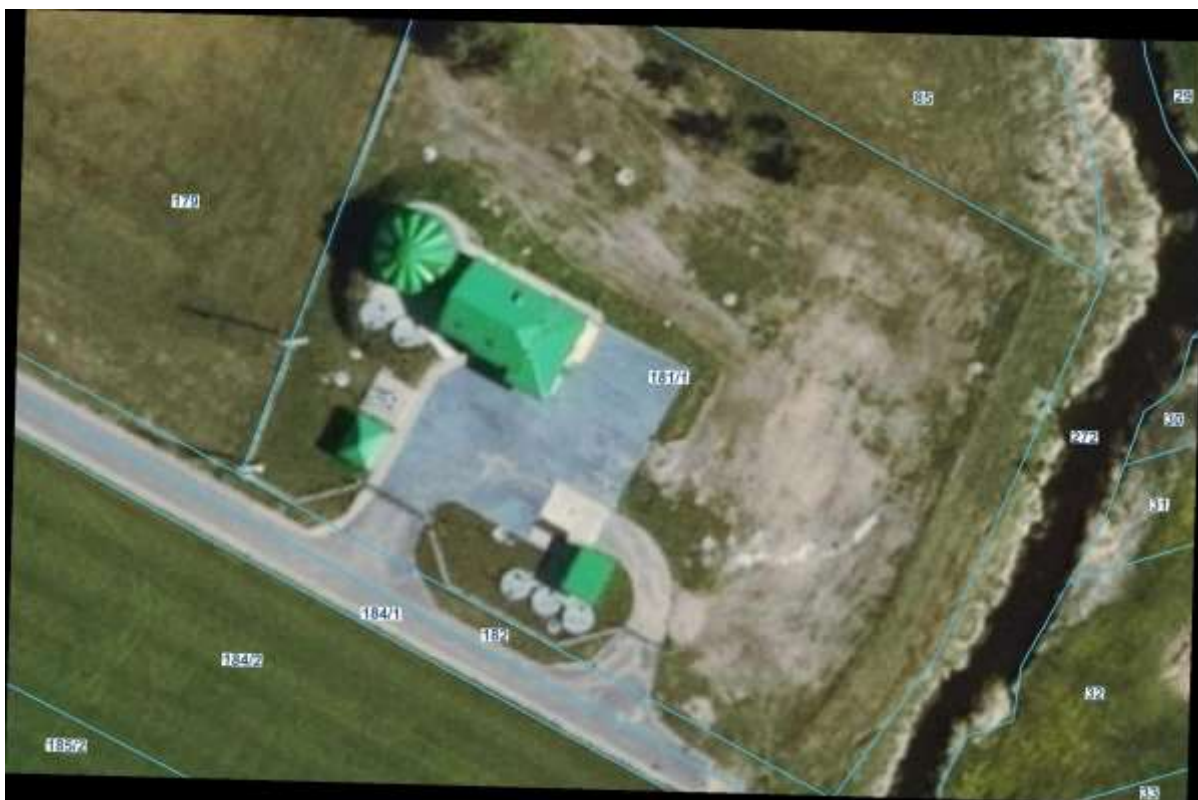
Rysunek nr 4. Lokalizacja 181/1: Budynek Oczyszczalni Ścieków , (źródło: https://zarebykoscielne.e-mapa.net/ dostęp na dzień 23.12.2022 r.)

https://zarebykoscielne.e-mapa.net/ dostęp na dzień 23.12.2022 r.)