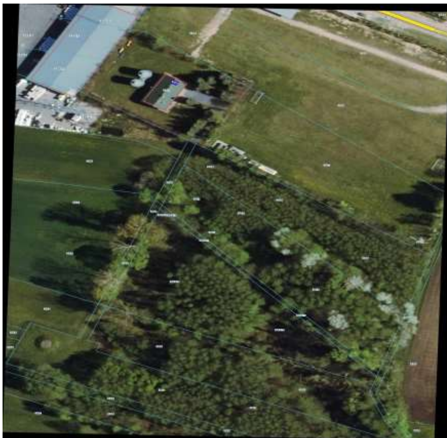
Rysunek nr 3. Lokalizacja dz. nr ew. 357.: Budynek Stacji Uzdatniania Wody , ul. Czyżewska (źródło: