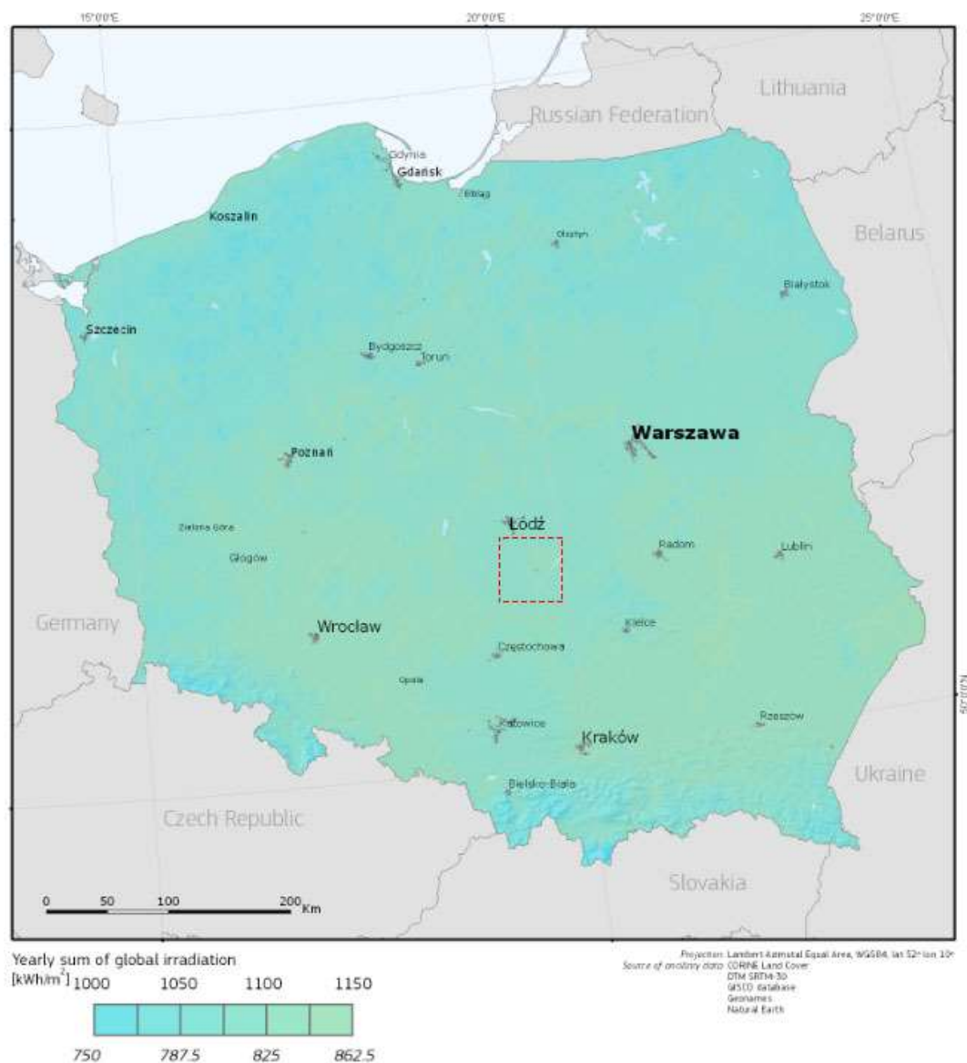
Rys. 1. Dawka promieniowania słonecznego możliwa do odebrania przez kolektory

Położenie obiektu, na którym planowany jest montaż, na mapie ma wpływ na pracę instalacji. W zależności od współrzędnych geograficznych rozbieżności w wartości promieniowania słonecznego mogą mieć znaczącą wartość. W skali kraju ilustruje to poniższa mapa (Rys.1).