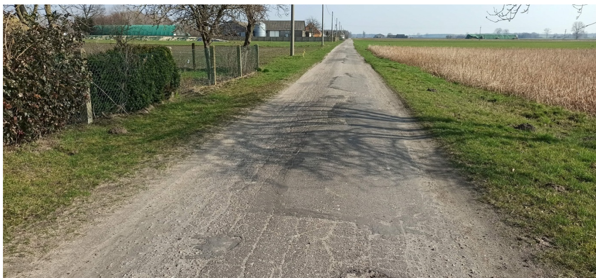
foto 4. KPT przebudowywanej drogi gminnej.