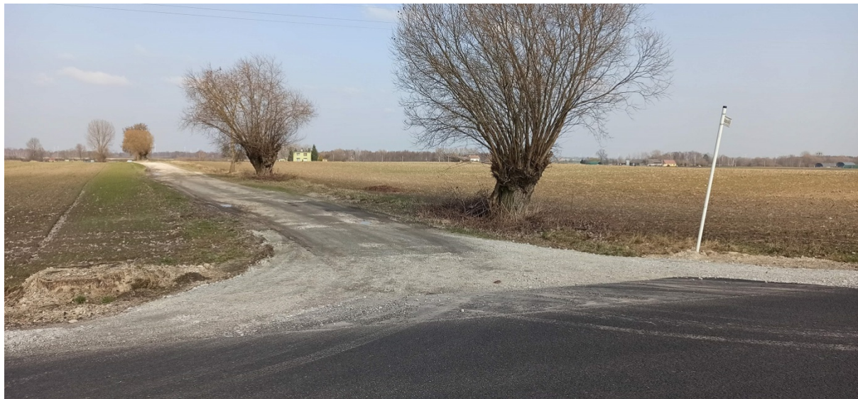
foto 1. PPT przebudowy drogi gminnej.

asfaltowym o szerokości 3,0 – 4,0 [m]. Wzdłuż drogi rosną pojedyncze drzewa, które mogą podlegać wycince i przycięciu koron w celu zachowania skrajni drogi. Uzbrojenie terenu stanowią elektryczne słupy napowietrzne, sieć wodociągowa oraz na części drogi sieć teletechniczna.