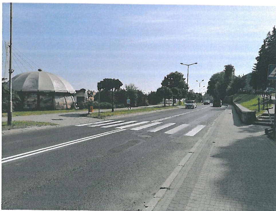
ISTNIEJĄCE PRZEJŚCIE DLA PIESZYCH UL. WYBRZEŻE MARSZAŁKA JÓZEFA PIŁSUDSKIEGO W PRZEMYŚLU