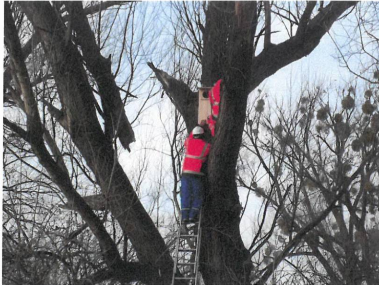
Fot. 14. Budki dla ptaków typ E dla nurogęsi oraz sów w km 5+000