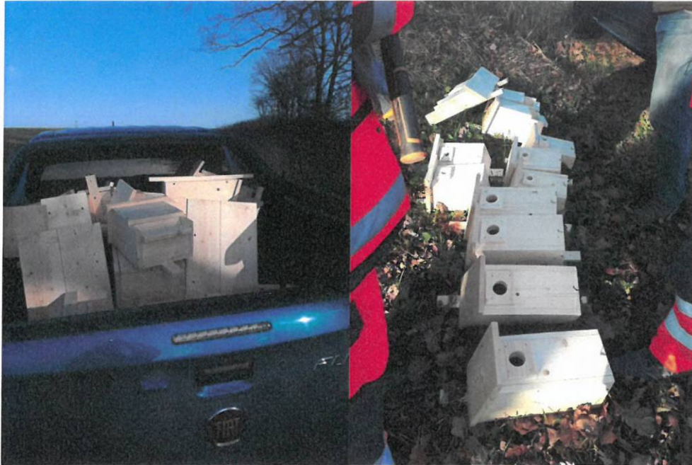
Fot.1-2. Budki łęgowe dostarczone przez firmę Mentor