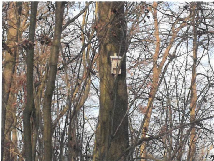
Fot. 6. Przykład budki typu Stratmann zawieszona w lokalizacji 1+500

Mentor Consulting sp. z o.o. Środowiskowa sp.k.