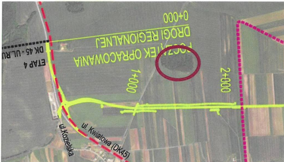
Ryc. 1. Remiza śródpolna w km ok. 1+500

Mentor Consulting sp. z o.o. Środowiskowa sp.k.