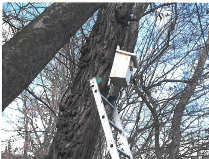
Fot. 9. Budka dla ptaków zawieszona w lokalizacji 3+200 (typ A)

Mentor Consulting sp. z o.o. Środowiskowa sp.k.