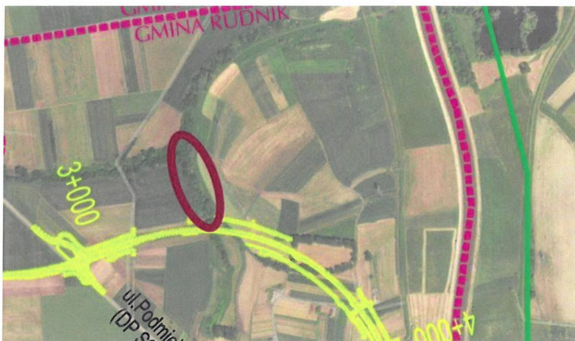
Ryc. 2. Śródpolne zadrzewienia wzdłuż rowu ok. km 3+200

W km 3+200, wśród zadrzewień śródpolnych, przy cieku, zawieszono 4 budki typu B oraz 3 budki typu A. Fot. 7-9.