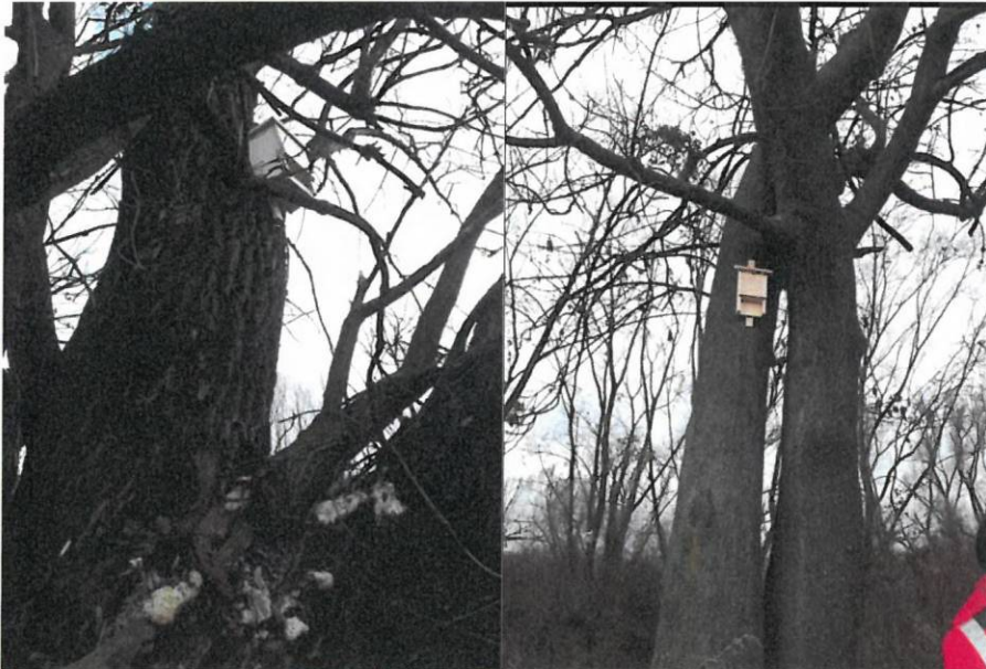
Fot. 12-13. Budki dla nietoperzy (Stratmann oraz Issel) zawieszono w km 5+000

Mentor Consulting sp. z o.o. Środowiskowa sp.k.