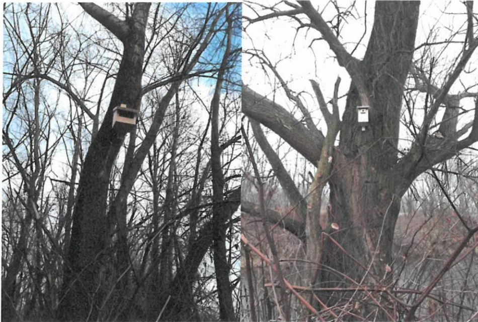
Fot. 10-11. Budki dla ptaków typ P oraz A zawieszono w km 5+000