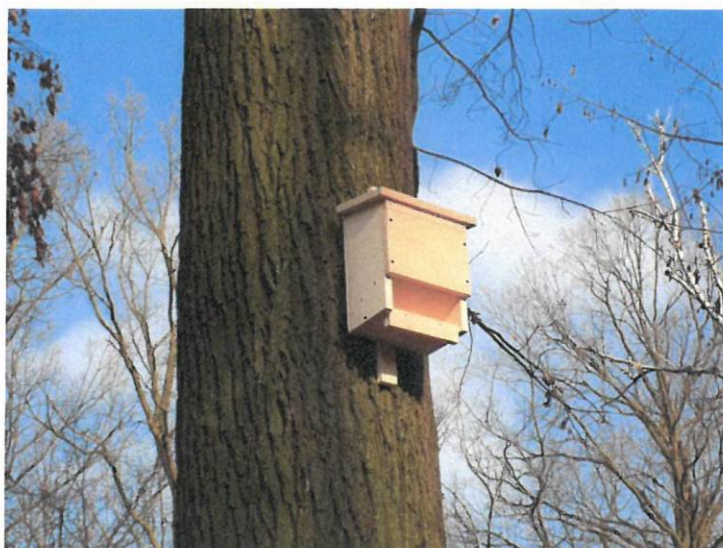
Fot. 4. Budka lęgowa dla nietoperzy typu Issel km 1+500

Mentor Consulting sp. z o.o. Środowiskowa sp.k.