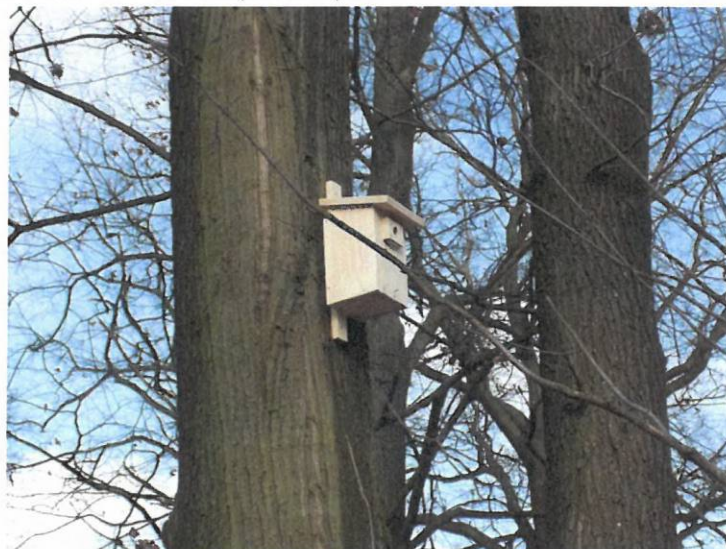
Fot. 3. Przykład budki typu B zawieszona w lokalizacji 1+500

W lokalizacji 1+500 ok. 300m od budowanego pasa drogowego znajduje się śródpolna remiza, gdzie powieszono 4 budki typu B, 8 sztuk budek typu A oraz po 2 budki dla nietoperzy typ Stratmann oraz Issel (fot. 3-6).