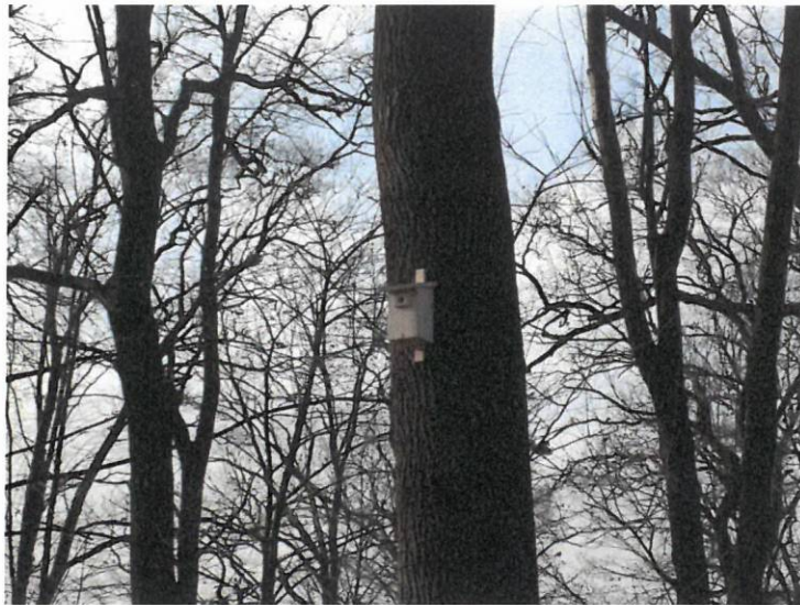
Fot. 5. Przykład budki typu A zawieszona w lokalizacji 1+500