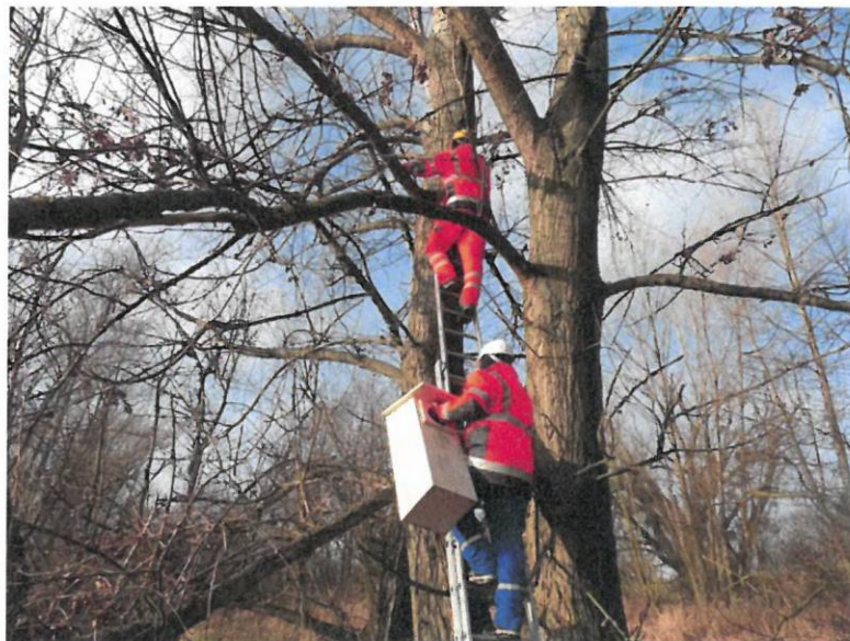
Fot. 15. Budki dla ptaków typ E dla nurogęsi oraz sów w km 5+000

Mentor Consulting sp. z o.o. Środowiskowa sp.k.