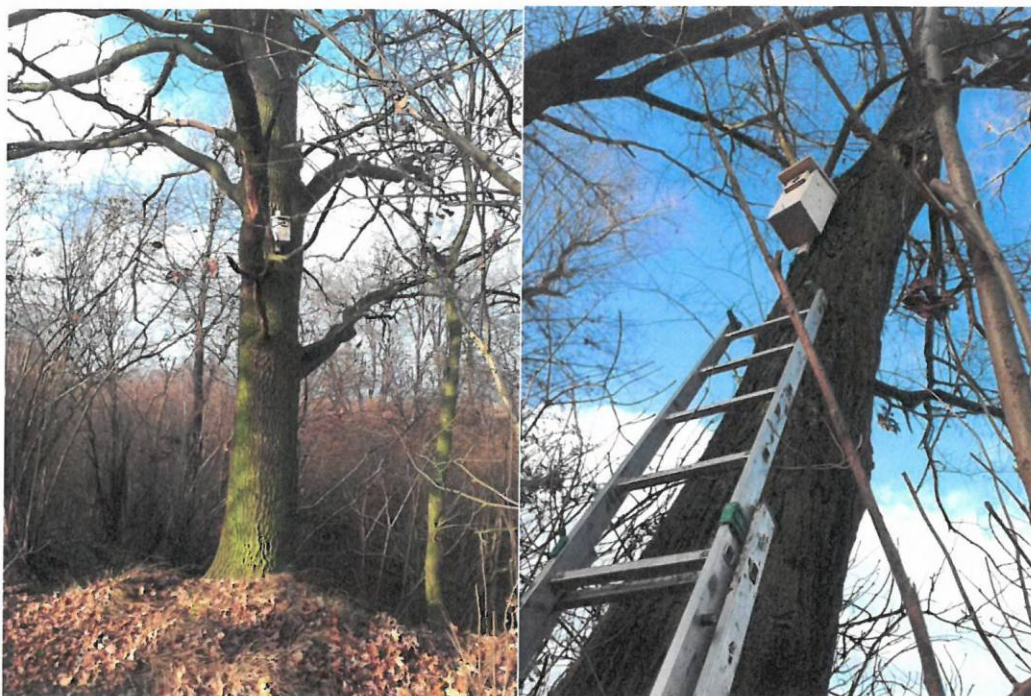
Fot. 7-8. Budki dla ptaków zawieszane w lokalizacji 3+200 (typ A i B)