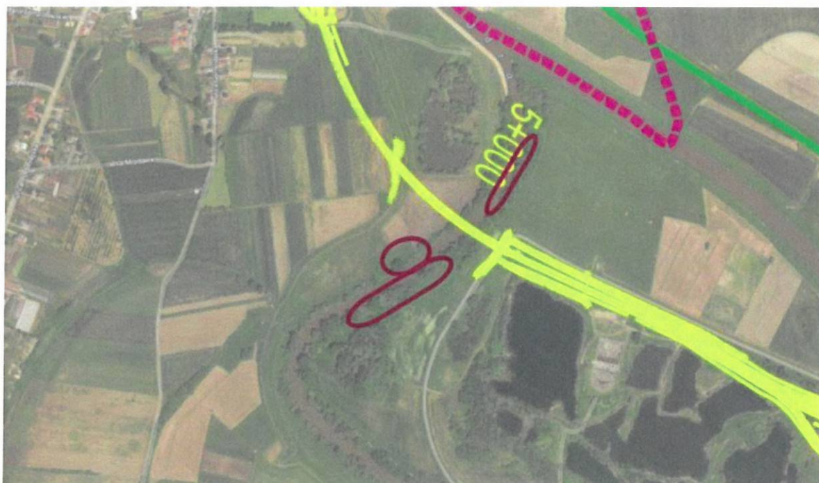
Ryc. 3. Łęgi nadrzeczne nad rz. Odrą w km 5+000

W km 5+000 po obu stronach rz. Odry powieszono 5 szt. budek typu A, 4 szt. typu P, jedną budkę typu B, po jednej budce dla nietoperzy obu zamówionych typów oraz 3 szt. typu E dla nurogęsi. Budki tego rodzaju są także zajmowane przez sowy. Fot. 10-16.