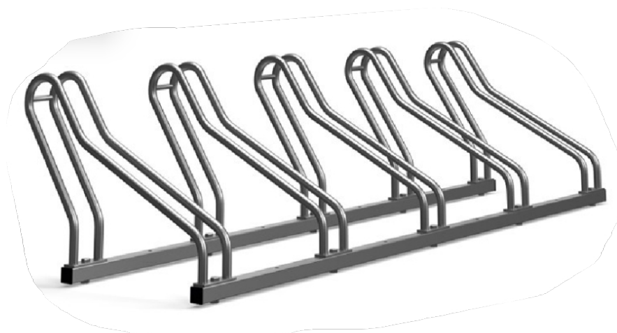
Widok przykładowego stojaka na rowery

Projektuje się montaż stojaka na rowery. Stojak ze stali ocynkowanej i pomalowanej proszkowo mocowany do wkopanych w grunt prefabrykowanych bloków betonowych (np. stopnie betonowe) za pomocą kotew chemicznych. Lokalizacja stojaka na rowery wg planu sytuacyjnego.