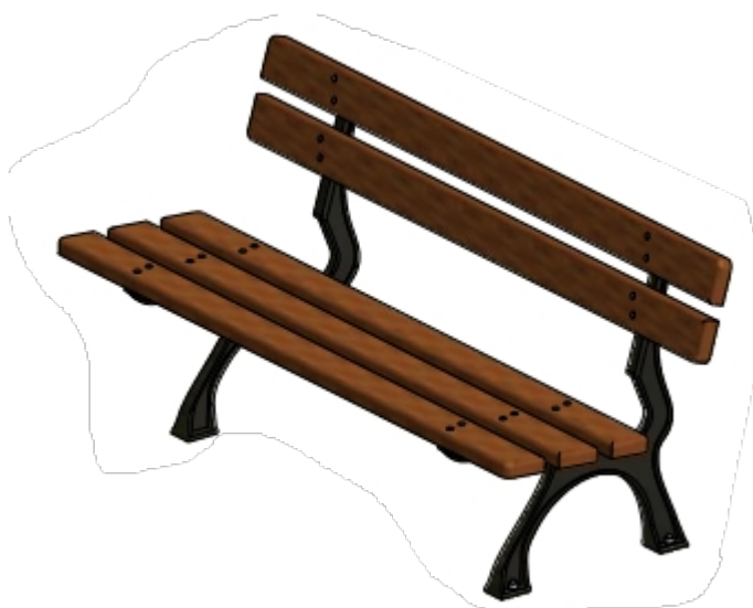
Widok przykładowej ławki rekreacyjnej

Projektuje się wykonanie dwóch ławek rekreacyjnych przy projektowanym miasteczku rowerowym. Ławki drewniane na stelażu stalowym ocynkowanym ogniowo i lakierowanym proszkowo mocowane do wkopanych w grunt prefabrykowanych bloków betonowych (np. stopnie betonowe) za pomocą kotew chemicznych. Lokalizacja ławek rekreacyjnych wg planu sytuacyjnego.