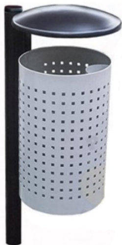
Widok przykładowego kosza na śmieci