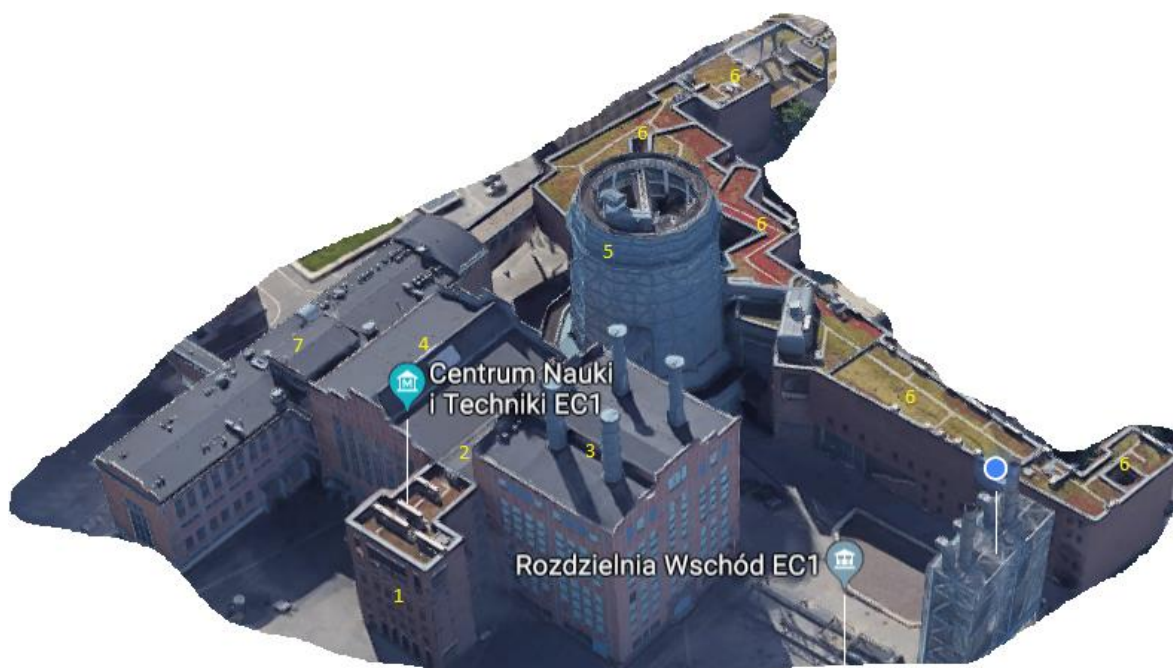
Tab. 3 Tabelaryczne zestawienie powierzchni budynków EC1 Zachód