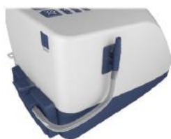
Zestaw do wlotu tlenu

W związku z tym, iż zestaw do wlotu tlenu jest elementem wyposażenia urządzenia Airvo2, prosimy Zamawiającego o doprecyzowanie ilości. Czy Zamawiający oczekuje wyceny 2 sztuk zestawu do wlotu tlenu, czy, zgodnie z przeliczeniem: 2 op. X 20 szt. czyli 40 szt.? Dla zobrazowania produktu załączmy zdjęcia: