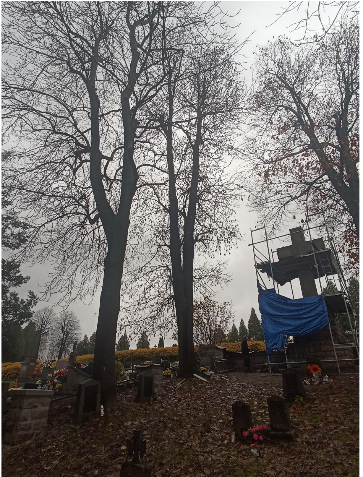
Drzewo Nr 7,