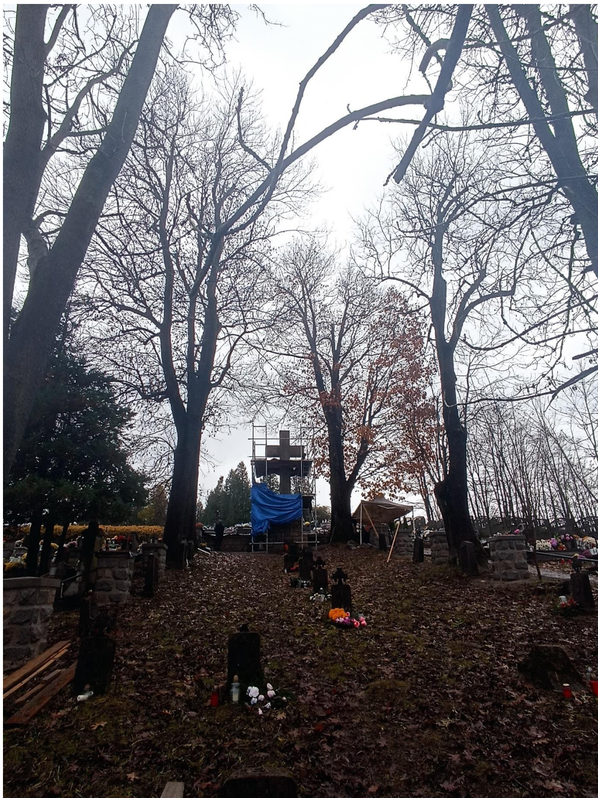
Drzewo Nr 6,