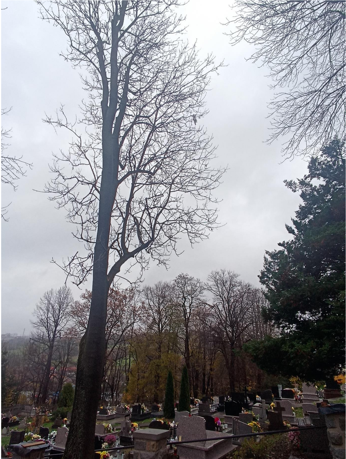
Drzewo Nr 8