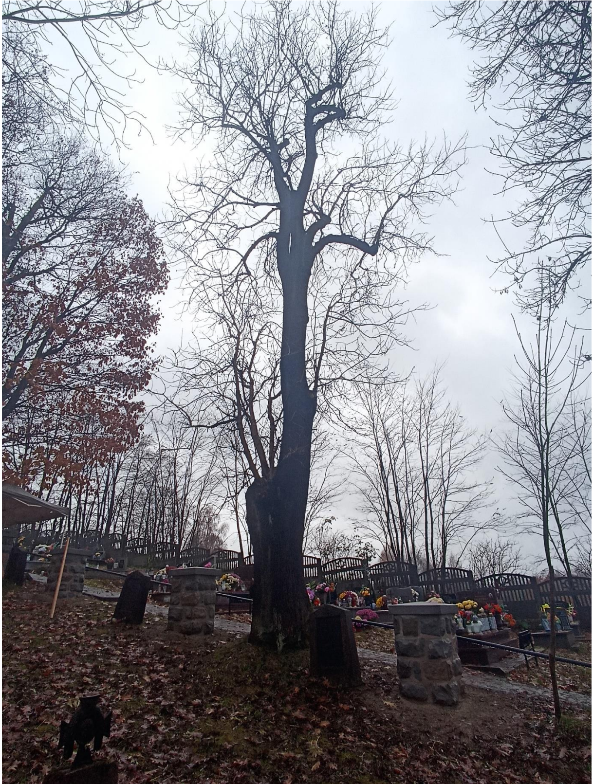
Drzewo Nr 4