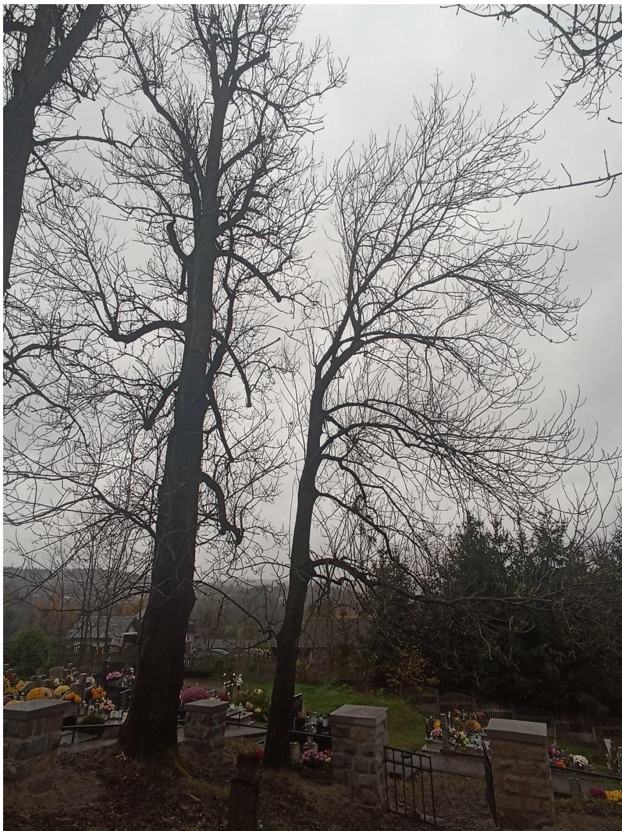
Drzewo Nr 2,