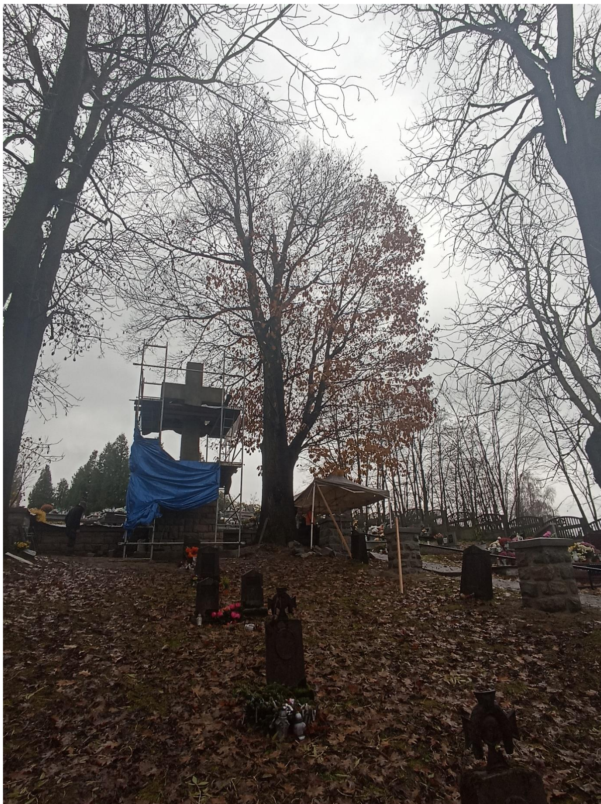
Drzewo Nr 5