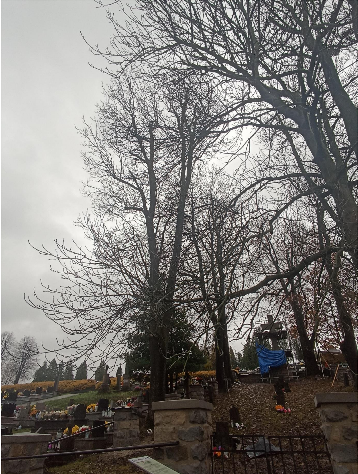
Drzewo Nr 8