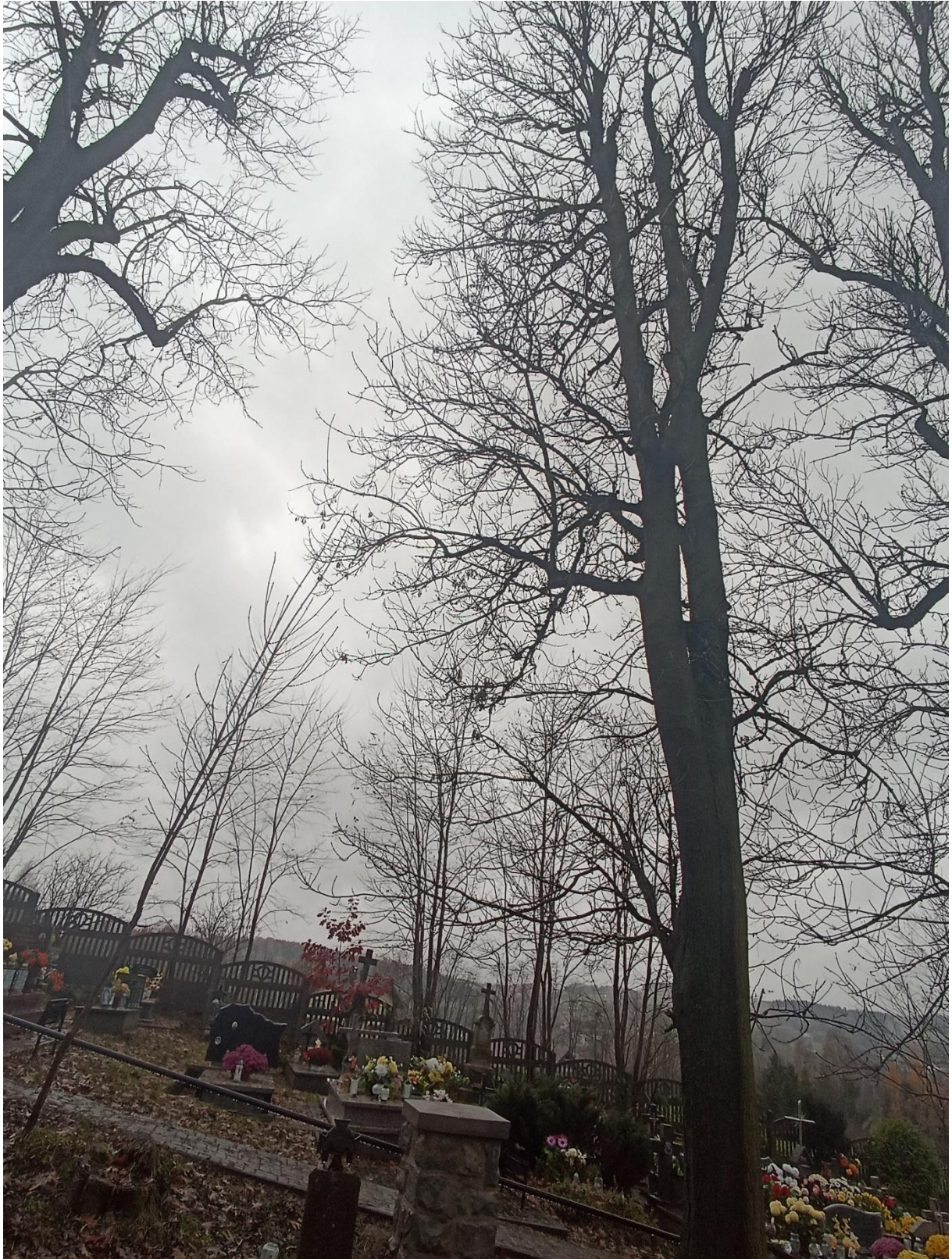
Drzewo Nr 3