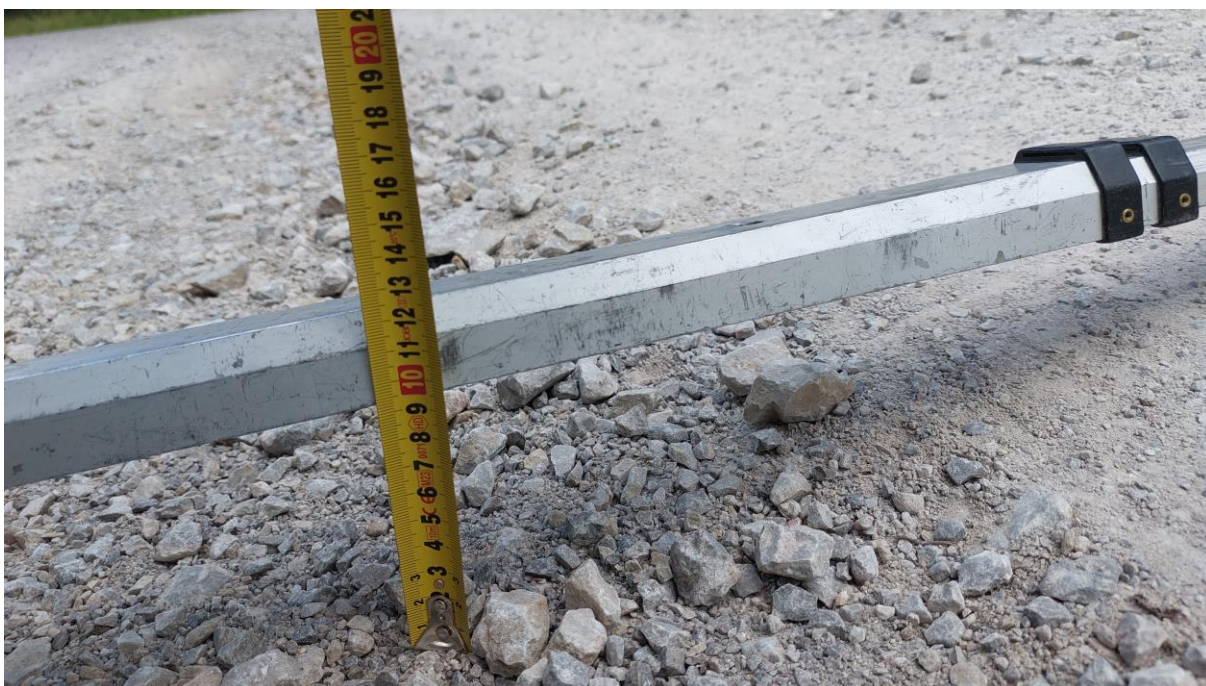
Zdjęcie 4. Szczegół rozmycia do zdjęcia poglądowego nr 2.