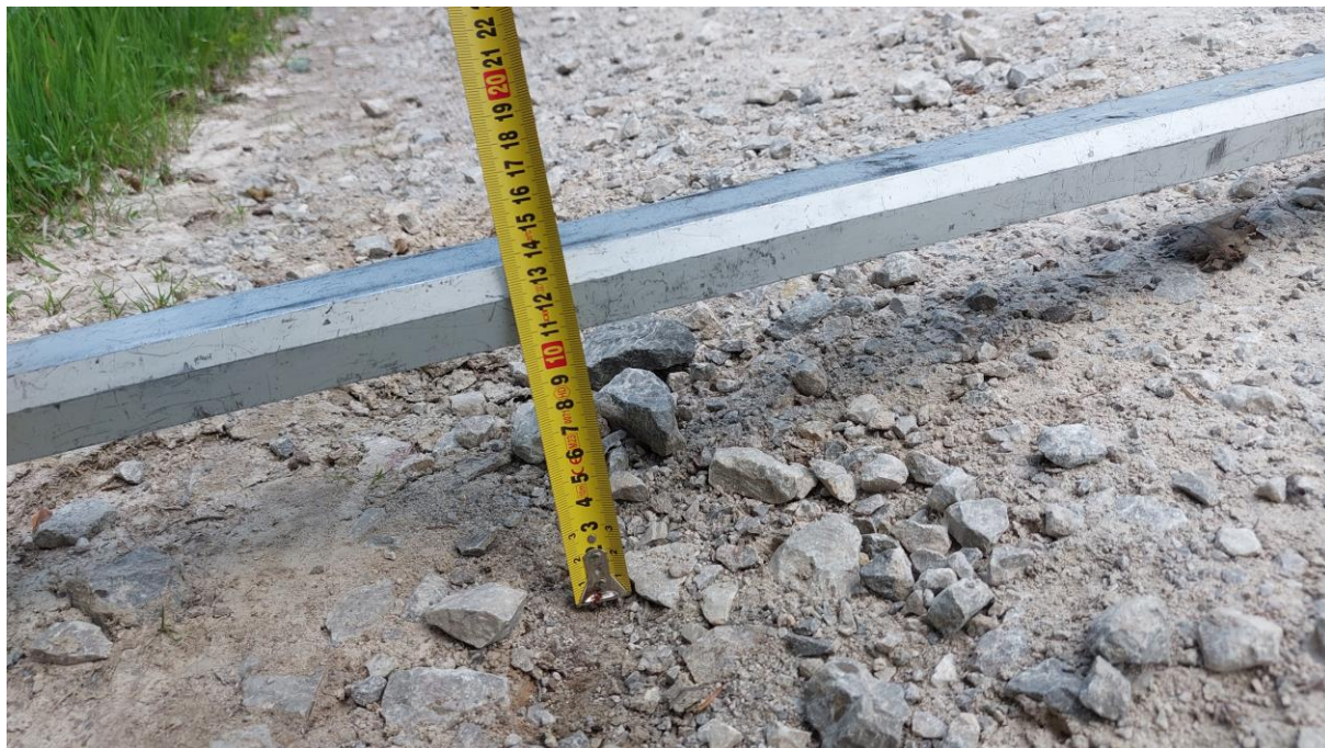
Zdjęcie 2. Szczegół rozmycia do zdjęcia poglądowego nr 1.