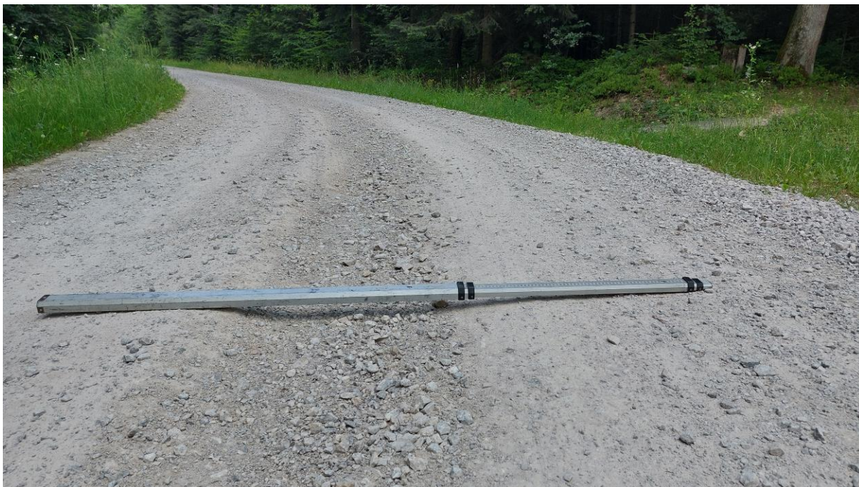
Zdjęcie 3. Zdjęcie poglądowe nr 2 - rozmyta nawierzchnia jezdni