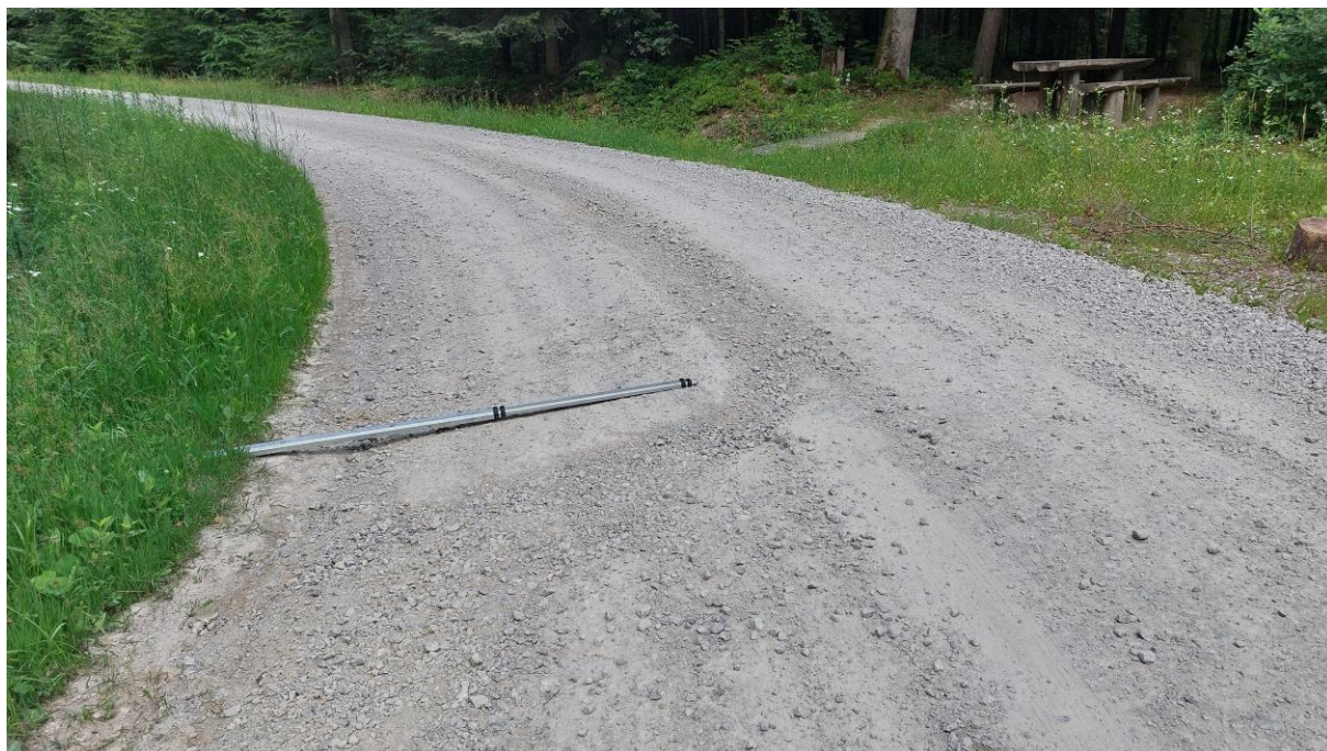
Zdjęcie 1. Zdjęcie poglądowe nr 1 - rozmyta nawierzchnia jezdni

Dokumentacja fotograficzna przedstawiająca stan istniejący nawierzchni drogi leśnej, która została rozmyta w wyniku silnych opadów deszczu.