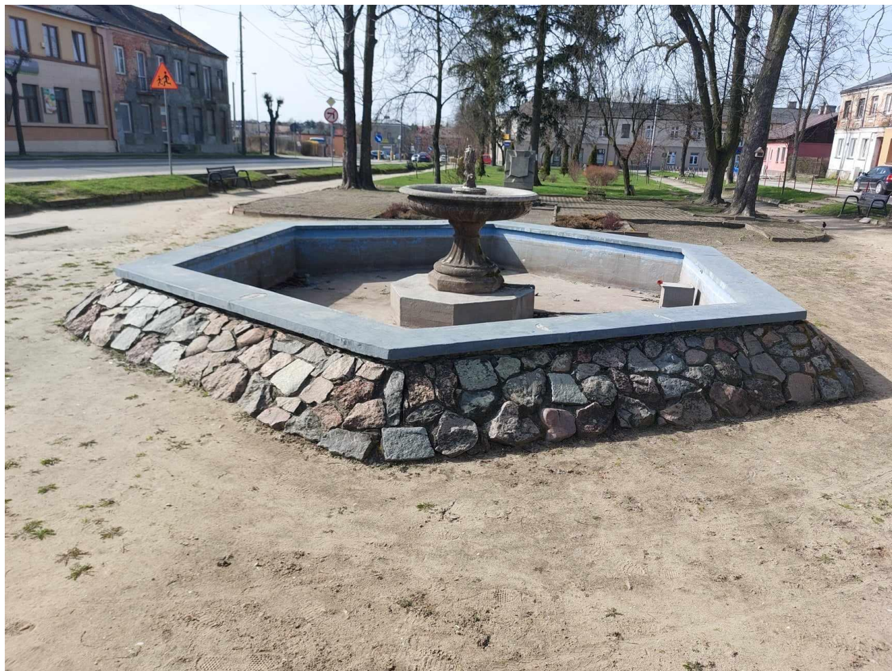
Rysunek 1. Fontanna