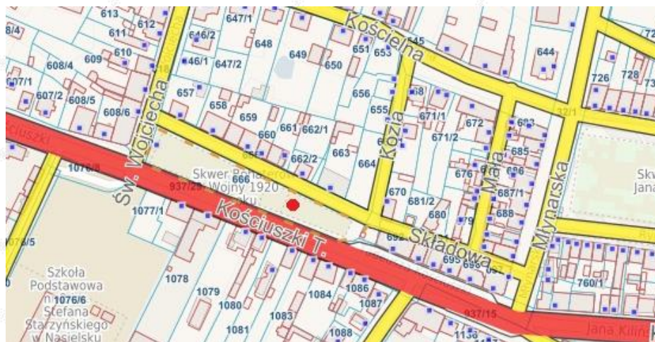
ORIENTACYJNA LOKALIZACJA OBIEKTU