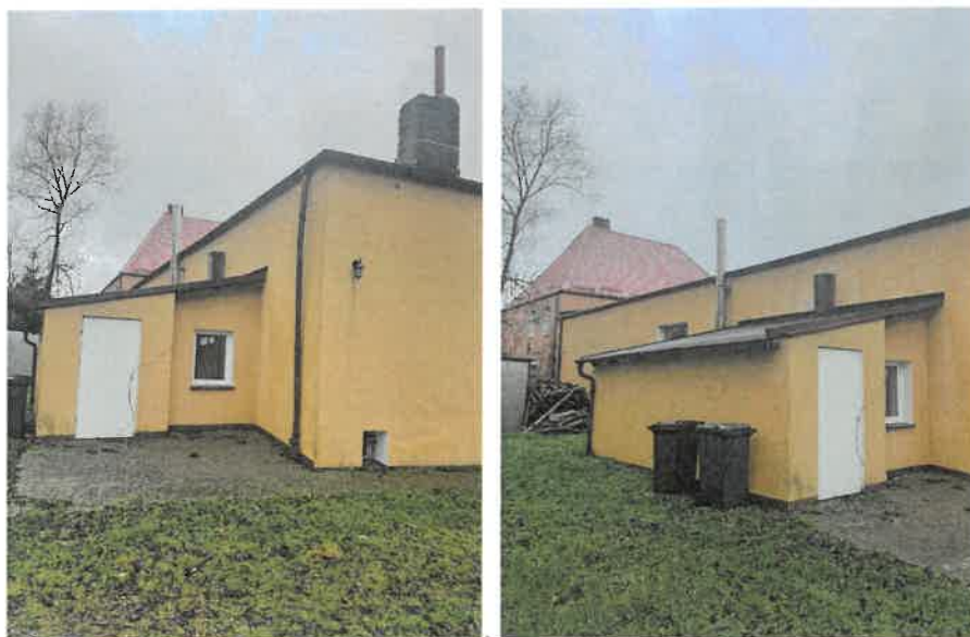
Fot. 1,2 Widok istniejącej elewacji budynku od strony południowej (przewidzianej do rozbudowy)

Dla terenu przedsięwzięcia brak jest miejscowego planu zagospodarowania przestrzennego.