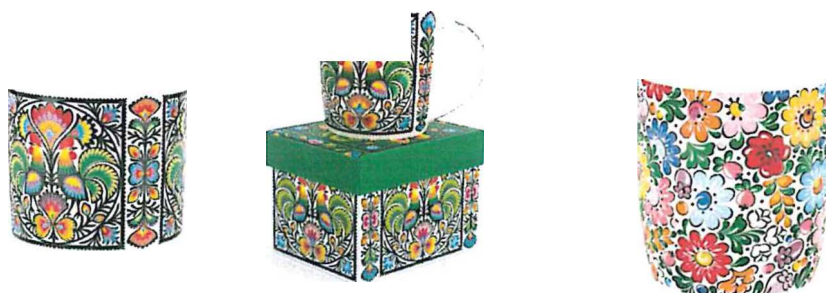
Przykładowe zdjęcia produktu

Zapakowany w estetyczne pudełko o wymiarach 12 cm +/- 2cm x 10 cm +/- 2 cm x 9 cm +/- 2 cm w kolorze granatowym, białym lub ze wzorem - odcień do uzgodnienia z Zamawiającym. Opakowania jednostkowe, pakowane w opakowania zbiorcze po 25 szt.+/- 5 szt.. Zabezpieczające przed zniszczeniem produktu.