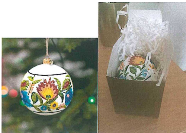
Przykładowe zdjęcie produktu

Opakowanie jednostkowe - pudełko kartonowe o wymiarach 11 cm x 11cm x 21 cm (+/-1,5 cm), w kolorze złotym (dopuszcza się również w innych kolorach - odcień do uzgodnienia z Zamawiającym). Pudełko umożliwiające schowanie bombki i unieruchomienie jej. Pakowane zbiorczo po 50 sztuk i okryte folią paletową.