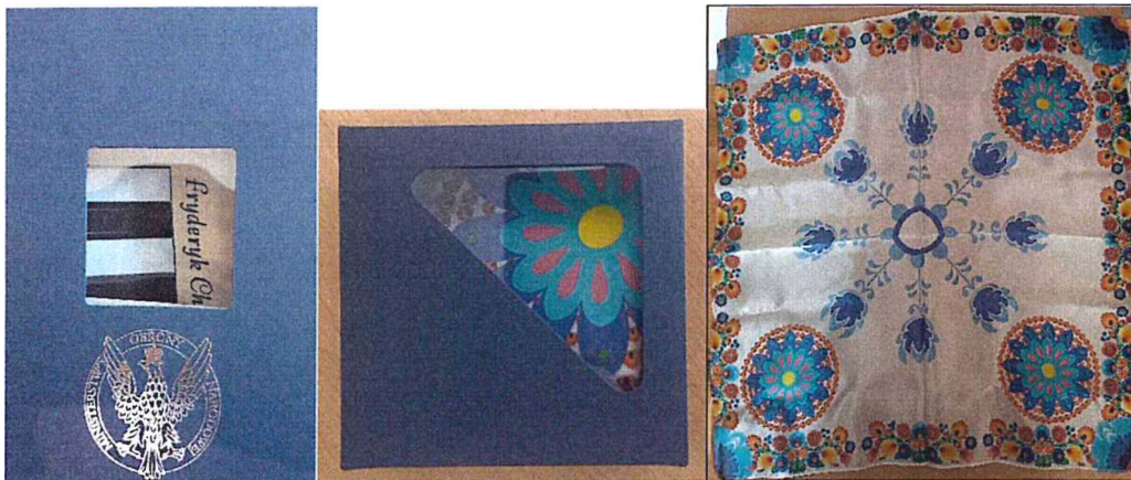
Przykładowe zdjęcia produktu