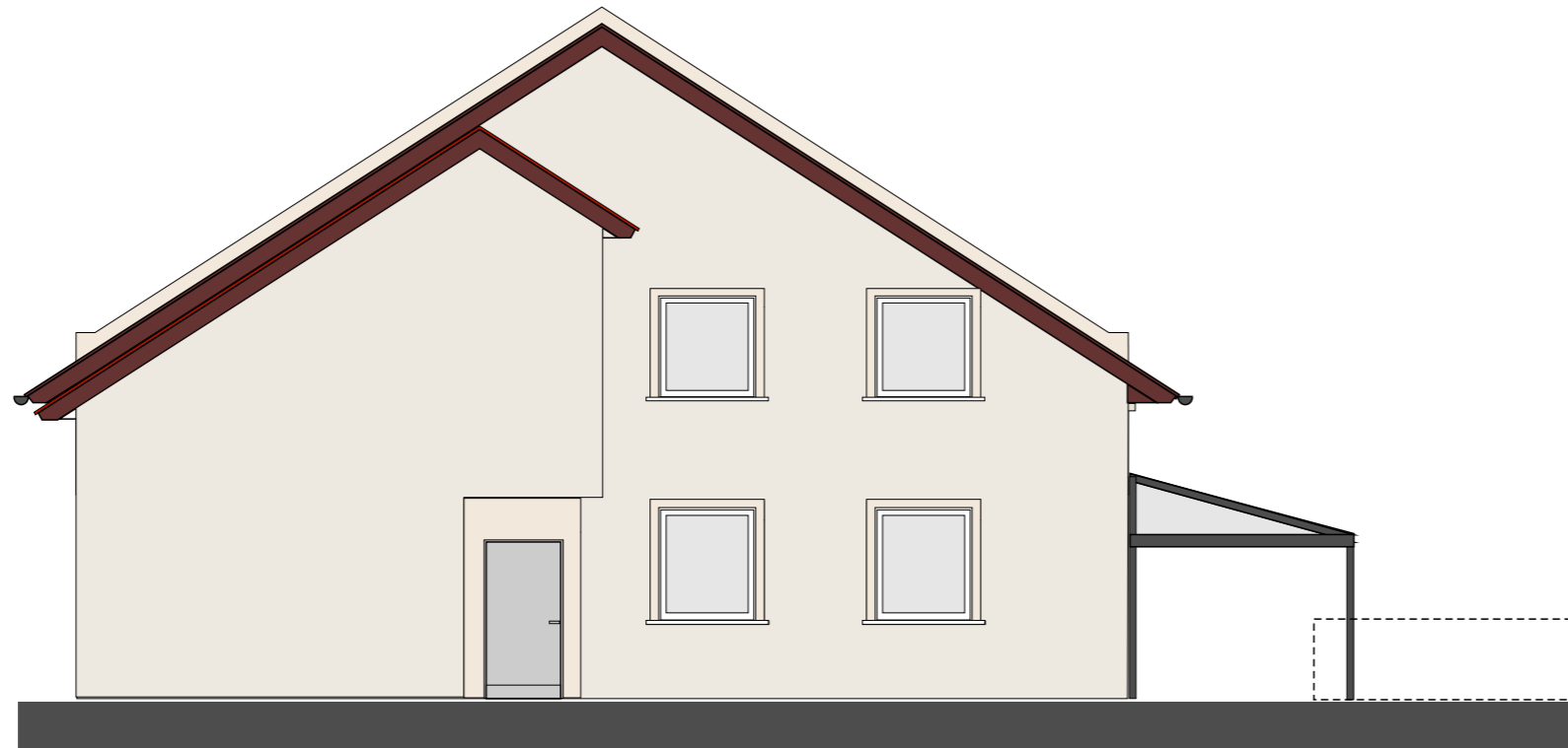
ELEWACJA POŁUDNIOWO- ZACHODNIA