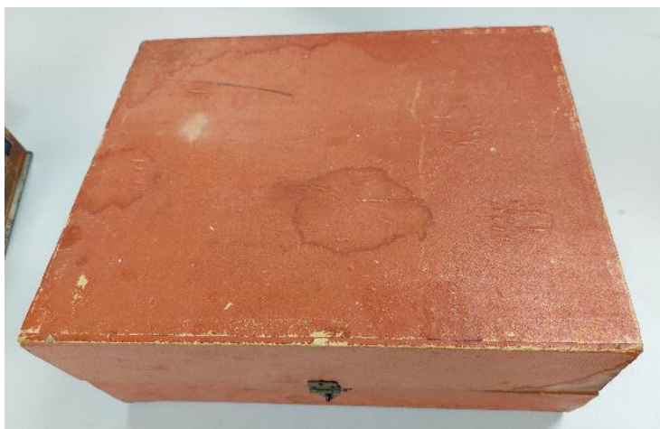
Luneta projekcyjna Newton (NCKF/M-277/1)