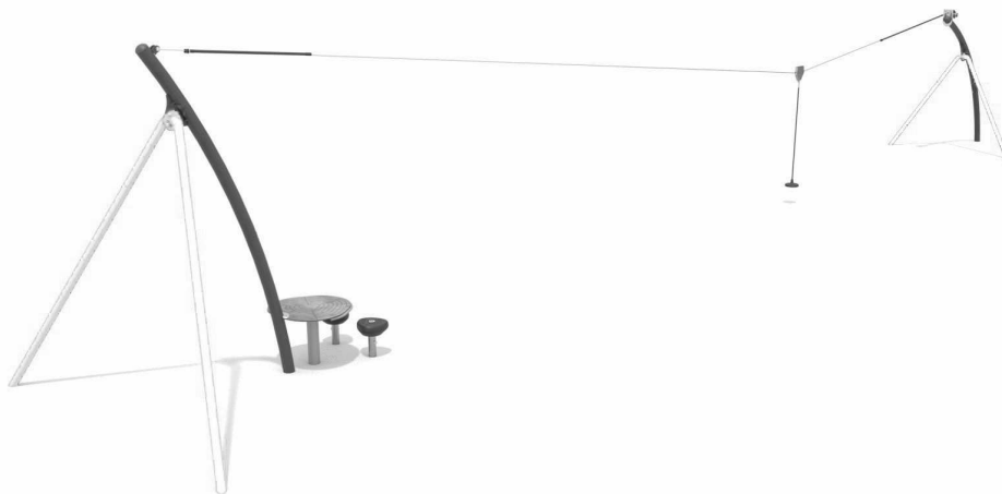
Fot. 2 Zjazd linowy (przykładowe zdjęcie)

Dopuszcza się urządzenia różnych producentów przy zachowaniu określonych w projekcie: