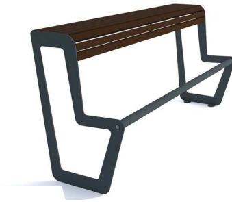
Fot. 3 Ławka młodzieżowa (przykładowe zdjęcie)