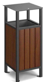
Fot. 4 Kosz (przykładowe zdjęcie)

Kosz mocowany za pomocą kotew rozporowych do fundamentów betonowych wykonanych wcześniej na budowie lub do fundamentów z prefabrykatów betonowych dostarczonych w komplecie z koszem.