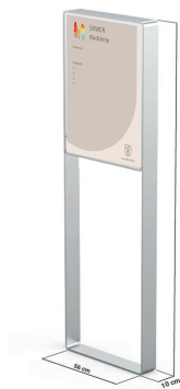
Fot. 5 Regulamin (przykładowe zdjęcie)