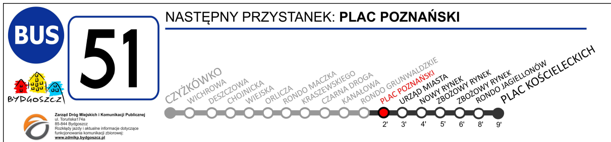
Rysunek nr 2a – Tablica boczna wewnętrzna – linia 51 (półkurs, kierunek przeciwny-wariant podstawowy, przebyty odcinek oznaczony na szaro)

Zamawiający, po uprzednim wyrażeniu zgody przez Organizatora i po uzgodnieniu z Organizatorem, może na tablicach wg wzoru przedstawionego na rysunkach nr 2 i 2a skorygować szatę graficzną i sposób wyświetlania informacji o ile zachowana przy tym zostanie zawartość merytoryczna przedstawiona na rysunkach 2 i 2a wymagana przez Organizatora funkcjonalność tablic.