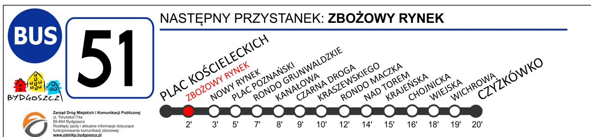
Rysunek nr 2 – Tablica boczna wewnętrzna – linia 51 (półkurs - wariant podstawowy)

Sposób prezentacji: w górnej części tablicy wyświetlany jest następny przystanek, następny przystanek wyróżniony zostaje kolorem czerwonym także na liście kolejnych przystanków, przebyta trasa (nazwy i symbole przystanków) oznaczona zostaje na szaro. Realizując każdy półkurs wykaz przystanków wyświetlany na tablicy musi odzwierciedlać wszystkie obsługiwane w danym półkursie przystanki. Jeśli w realizowanym półkursie dany przystanek nie jest obsługiwany to nie może on znajdować się na wyświetlanym przez tablicę wykazie przystanków (chodzi o sytuację w której przystanek obsługiwany jest tylko w jednym kierunku). Podsumowując: wykaz przystanków wyświetlany na tablicy musi być tożsamy z wykazami przystanków zawartymi w przekazywanych przez Organizatora kartach B, z uwzględnieniem kierunku półkursu oraz poszczególnych wariantów przebiegu.