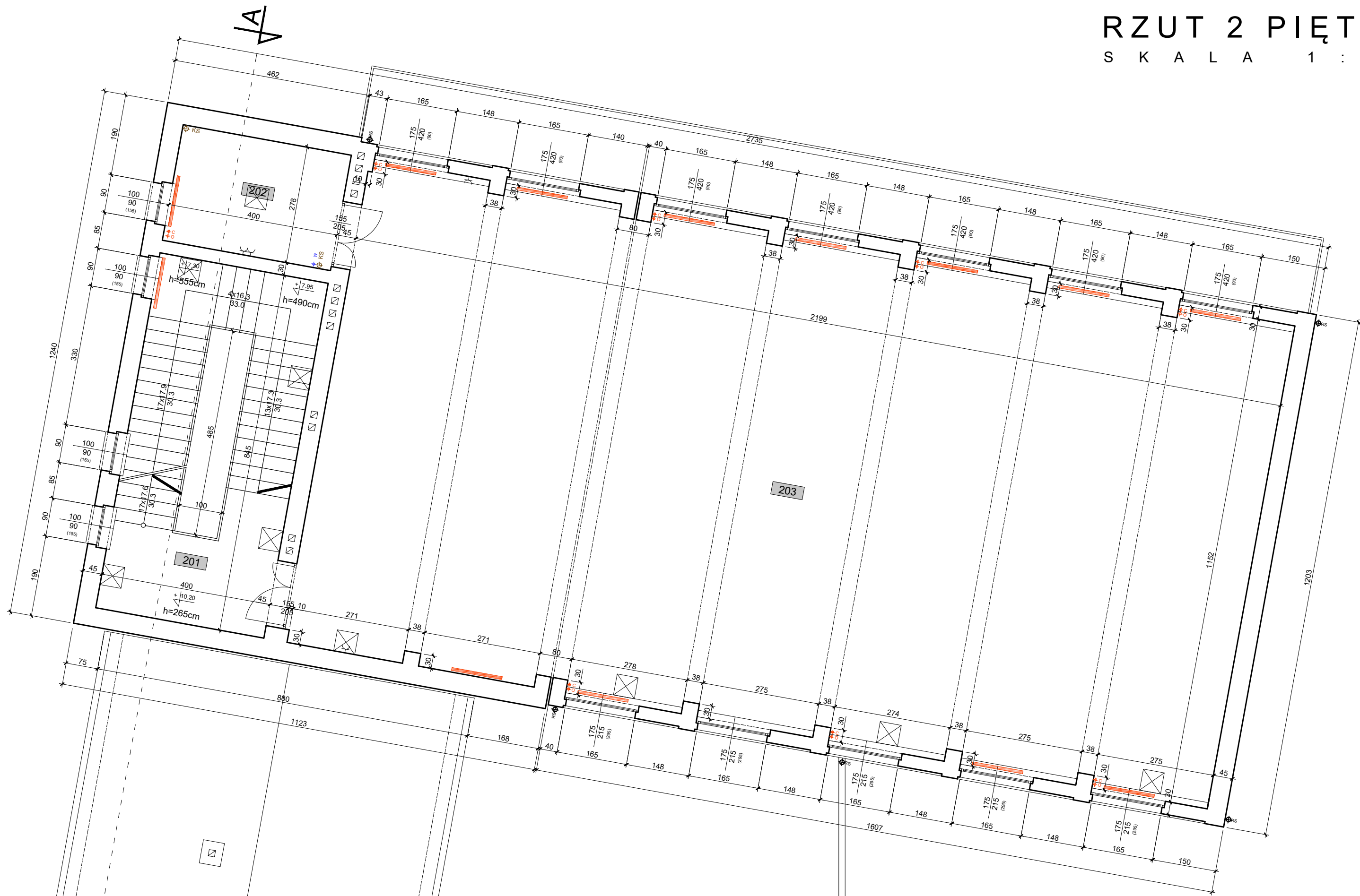
RZUT 2 PIĘTRA S K A L A 1 : 5 0