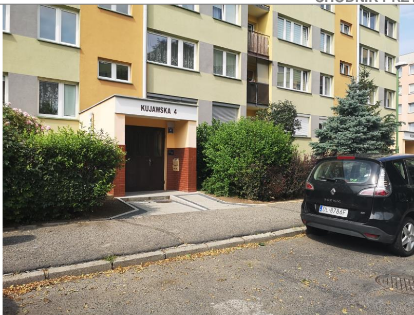
Zdjęcie 8 Kujawska 4