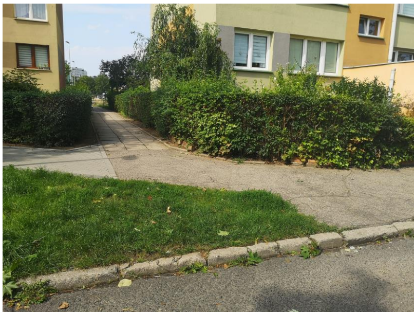
Zdjęcie 1 Początek opracowania

Dokumentacja fotograficzna została wykonana 17.08.2023r. Przedstawia stan istniejący, będący podstawą do prac projektowych.