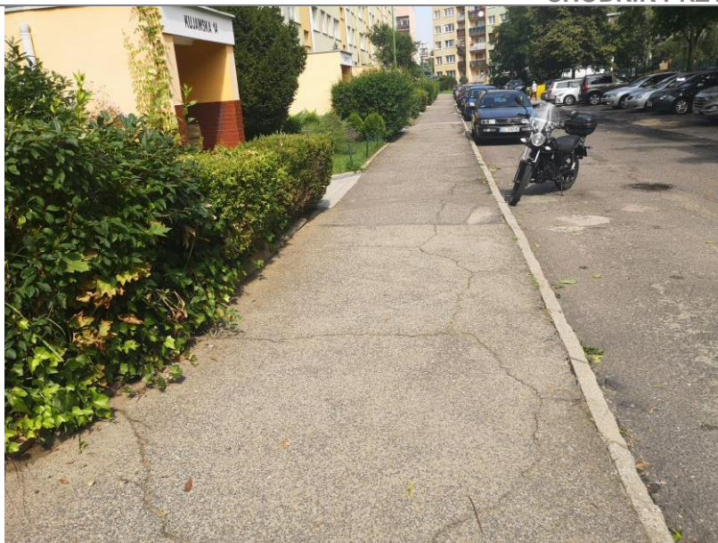
Zdjęcie 2 Widok na istniejący chodnik do przebudowy