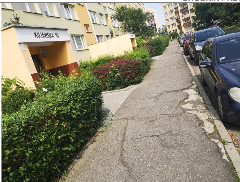
Zdjęcie 5 Kujawska 10