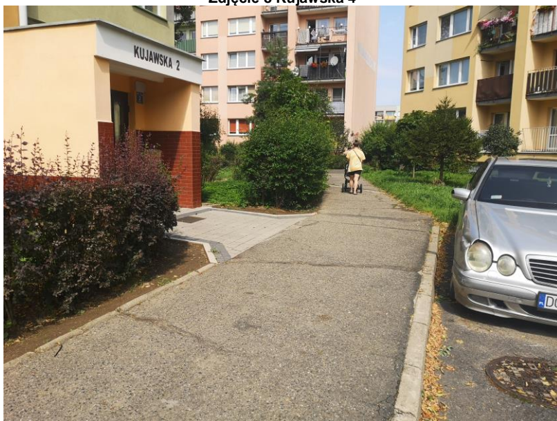
Zdjęcie 9 Kujawska 2, koniec opracowania