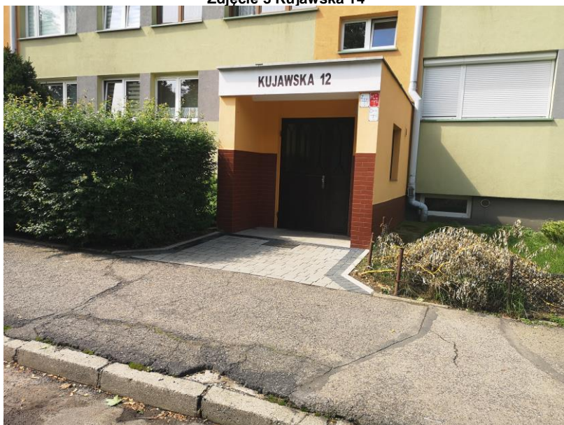
Zdjęcie 4 Kujawska 12