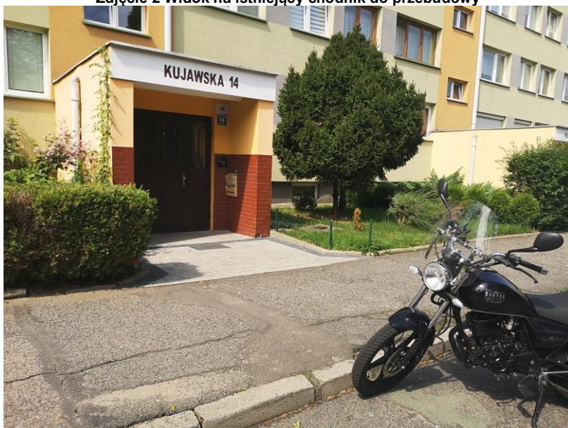
Zdjęcie 3 Kujawska 14